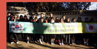
2014年1月/日本での交流の様子